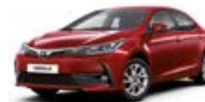
3T3 Червоний перламутр 2