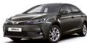
1G2 Сірий 2