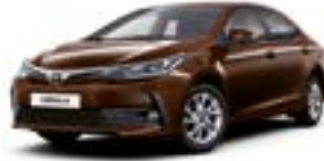
4U3 Коричневий 2