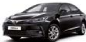
209 Чорний 2