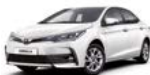
070 Білий перламутр 2