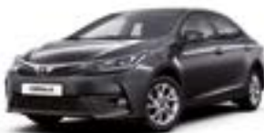
1G3 Сірий 2