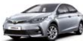
1F7 Сріблястий 2