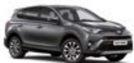
1G3 Сірий 5