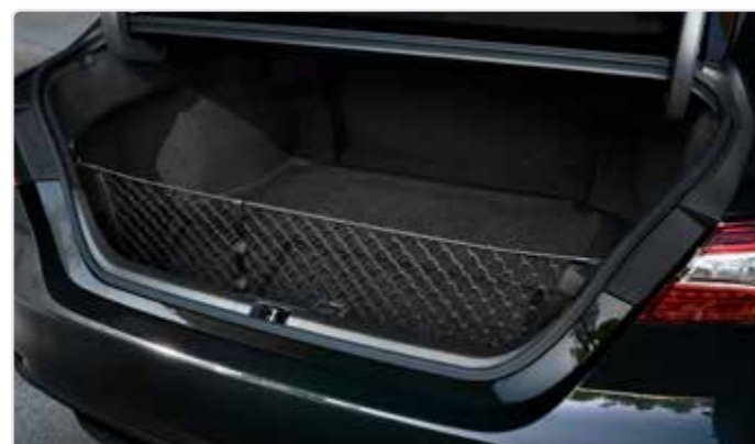
Вертикальна сітка кріплення вантажу