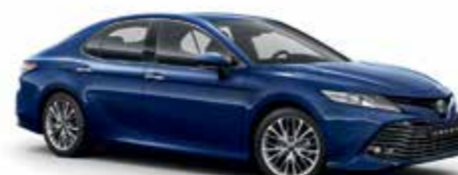
8W7 Темно-синій 1