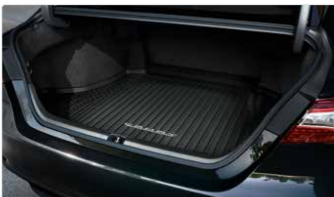
Килимок багажного відділення