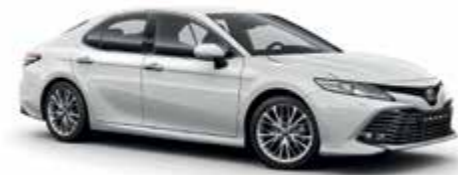
089 Білий 1