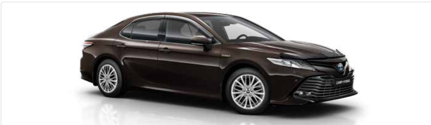
Дефлектор вікон з хромованим окантуванням