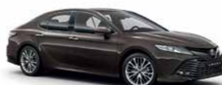
4X7 Коричневий 1