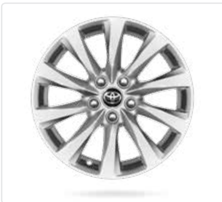
Легкосплавні диски 16"