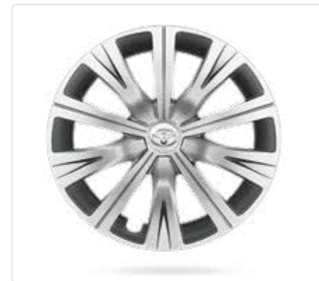
Легкосплавні диски 17"