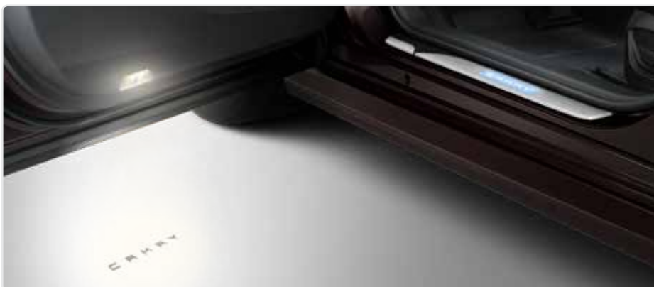
Проекція логотипа «Camry»