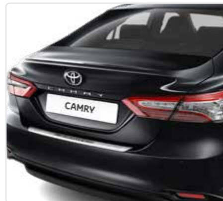
Захисна накладка заднього бампера