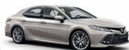
4X1 Бежевий 1