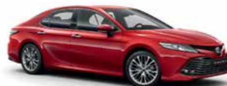
3U5 Червоний 1