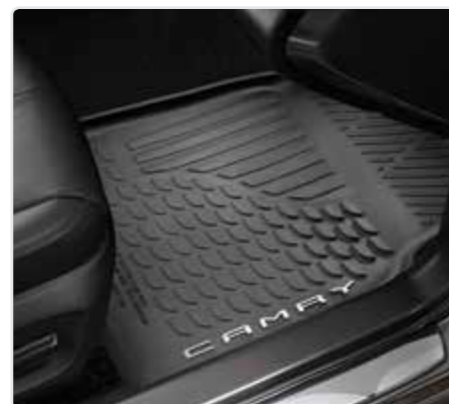
Гумові килимки салона, чорні