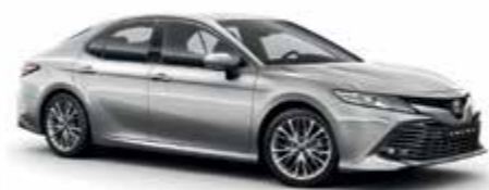
1F7 Сріблястий 1