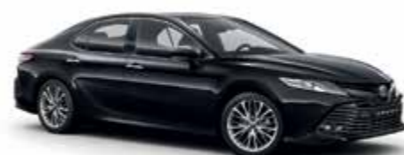
218 Чорний 1